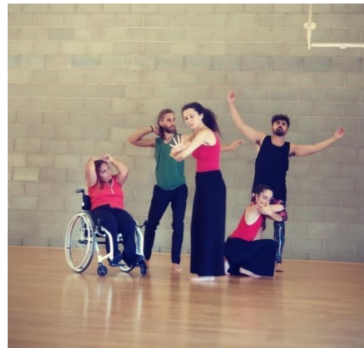
ESPECTACLE DE DANSA INCLUSIVA Cia. La Mujer del carnicero - ImpulsaT Ajuntament de Llagostera

LAMA2 — EUROPE — ¡Juntos somos más fuertes!