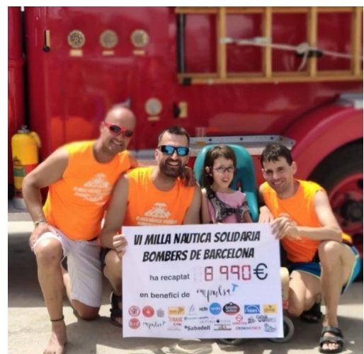
VI MILLA NÀUTICA A FAVOR D'IMPULSAT Bombers de BCN i Bomebrs Solidaris