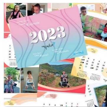
Dissenyat per Maier King Lara

COMPRA ELS NOSTRES PRODUCTES SOLIDARIS I REGALA ESPERANÇA!