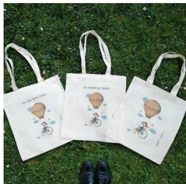
Il·lustrat per Andrea Zayas