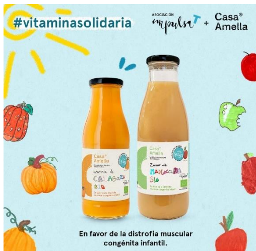
CAMPANYA #VITAMINASOLIDARIA A FAVOR D'IMPULSAT Casa Amella - ImpulsaT