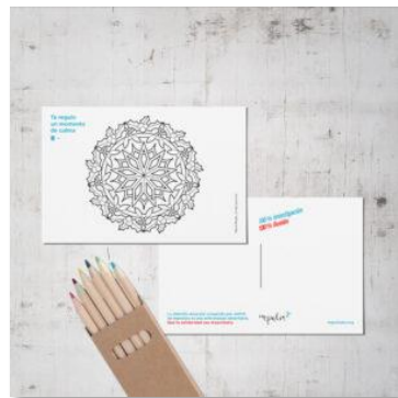
Il·lustrat per Mercè Badia