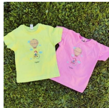
Il·lustrat per Andrea Zayas